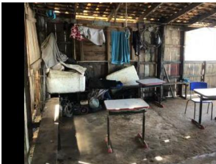
(Fotografia da sala e aula improvisada, constante da Vistoria juntada aos autos)

No caso da ESCOLA MUNICIPAL DO “PONTAL trata-se segundo o MP, de unidade de ensino que segundo relatos dos responsáveis pela comunidade local, atende aproximadamente 45 (quarenta e cinco) alunos, e é situada em um determinado empreendimento conhecido por “barracão”, coberto por palhas, com chão batido e sem qualquer tipo de conforto e acomodações adequadas tanto para os alunos como para os professores.