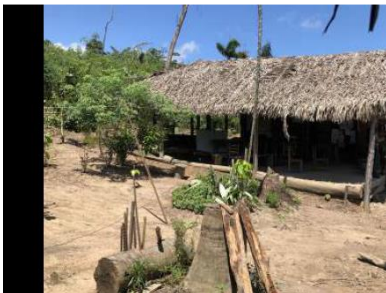
(Fotografia da Escola Municipal do Pontal, retirada da Vistoria realizada pelo MP constante dos autos)

No caso da ESCOLA MUNICIPAL DO “PONTAL trata-se segundo o MP, de unidade de ensino que segundo relatos dos responsáveis pela comunidade local, atende aproximadamente 45 (quarenta e cinco) alunos, e é situada em um determinado empreendimento conhecido por “barracão”, coberto por palhas, com chão batido e sem qualquer tipo de conforto e acomodações adequadas tanto para os alunos como para os professores.