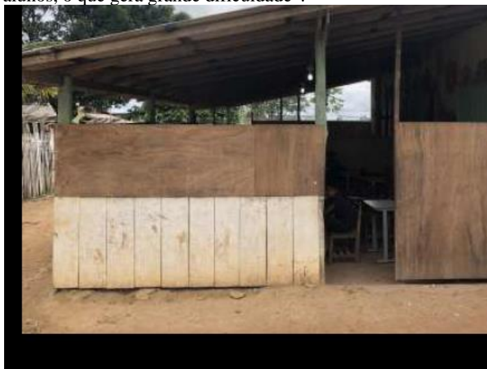
(Fotografia da EMEF RAIMUNDO MONTEIRO constante da Vistoria realizada pelo MP, conforme documento juntado aos autos).

Reportou que no dia da visita “não possuía qualquer tipo de proteína para servir aos alunos, sendo que, segundo relatos dos profissionais que ali trabalham, tal situação é completamente recorrente na unidade de ensino. Ademais, para que a merenda chegue à escola, o Diretor da Unidade de Ensino precisa se deslocar cerca de 50 km para buscar algum alimento para servir aos alunos, o que gera grande dificuldade”.