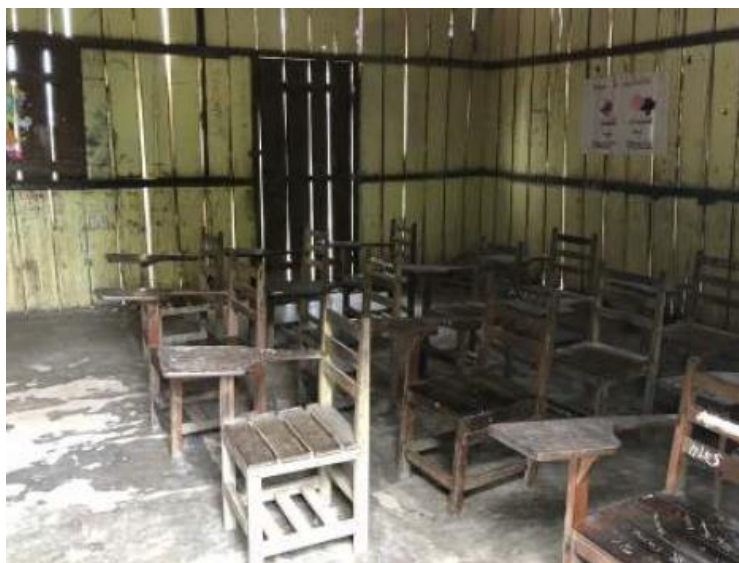
(Fotografias da EMEF NOSSA SENHORA APARECIDA colacionadas à Vistoria do MP constante dos autos).

Relatou o parquet “que no banheiro da escola situado na parte dos fundos, foi constatada a existência de uma fossa química completamente aberta, apresentando sérios riscos de proliferação de doenças, sem contar no completo desconforto dos alunos em decorrência do forte odor exalado ao meio ambiente. Ademais, é inegável que é completamente possível que algum aluno possa cair no local haja vista que não existe qualquer tipo de proteção ou aviso no local.” Disse ainda que “a água ingerida pelos alunos também é completamente imprópria para o consumo, não possuindo qualquer tipo de tratamento”.