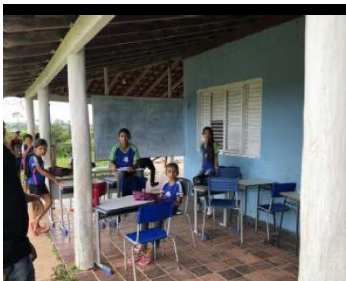
(Fotografia da EMEF JOAQUIM ALVES BARBOSA acostada na Vistoria do MP juntada aos autos)

No que se refere à EMEF JOAQUIM ALVES BARBOSA narrou o MP sobre a existência de duas “salas de aula” improvisadas na varanda do prédio onde funciona a Unidade de ensino, de forma completamente inadequada, acarretando sério desconforto aos alunos e profissionais em razão das altas temperaturas da região onde a escola é situada”.