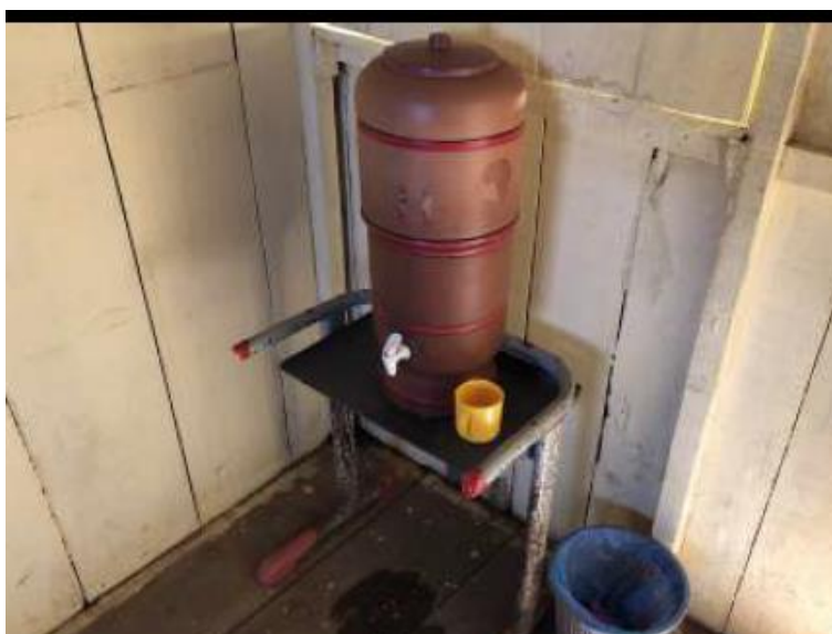
(Filtro contendo água do Lago da UHE Tucuruí, par consumo das crianças, conforme Vistoria do MP)

Situação pior foi verificada na ESCOLA MUNICIPAL “PRESIDENTE PRUDENTE DE MORAES pois segundo o MP “a escola em tela é completamente inapropriada para o ensino, notadamente pelo fato de não possuir condições estruturais adequadas para tal. Ademais, pelo fato de ter a estrutura física completamente de madeira, a escola não possui forro entre as telhas, o que acaba aumentando demasiadamente a temperatura das salas de aula. A escola é abastecida com energia elétrica oriunda de geradores, porém, são frequentes os dias em que não possui qualquer fagulha de energia, haja vista que a Prefeitura Municipal não disponibiliza o óleo diesel/gasolina necessário para os dias da semana. Registra ainda o representante do Órgão Ministerial que na data da visita “os alunos tiveram que ser liberados mais cedo, em razão de que, naquela oportunidade, não haver merenda escolar para os alunos, razão pela qual os professores não tiveram outra escolha, senão o de encaminhar os alunos para suas respectivas residências” e que “os alunos ingerem água diretamente do lago da UHE, sendo que, no caso desta, especificamente, o bebedouro utilizado pelos alunos é um determinado filtro de barro, alocado em uma mesa danificada”.