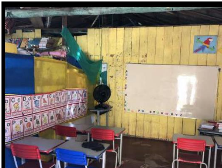
(Fotografia da sala de aula infantil da EMEF DEUSELITA constante da Vistoria do MP juntada aos autos)

Ainda segundo o representante Ministerial na EMEF DEUSELITA “os professores informaram que a escola municipal atende cerca de 139 (cento e trinta e nove alunos) nos turnos matutino e vespertino” e que “a sala de aula de atendimento dos alunos do ensino infantil funciona de forma improvisada em um determinado quarto em uma casa ao lado da unidade”